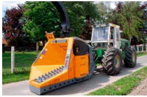
De TV40 -52 "GIANT" = de grootste versnipperaar type "messenschild" op de markt.