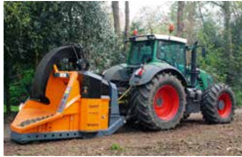
Standaard uitvoering voor 3-puntsophanging tractor.