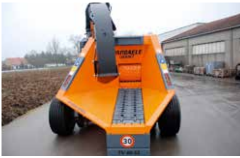
De machine werd speciaal ontworpen met brede invoertrechter met ketting en is uitsluitend geschikt voor kraaninvoer.