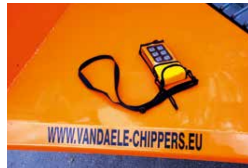
Alle bedieningsfuncties worden elektro-hydraulisch gestuurd door middel van een draadloze afstandbediening