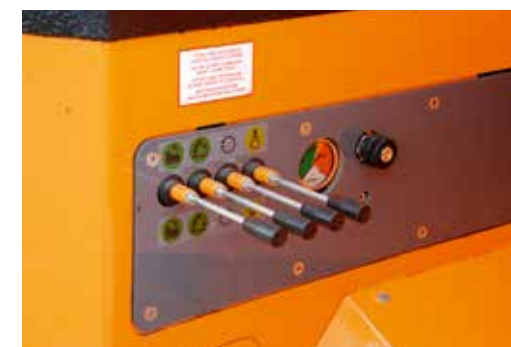
Servicetoegang voor technische controles via handbediende pomp met verdeelblok.