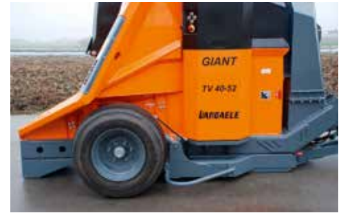
Optie: onderstel traag vervoer met hydraulisch intrekbare wielen en hydraulisch in hoogte verstelbare dissel.

De “reus” in het Vandaele gamma. Dit model werd speciaal ontwikkeld om aan de meest veeleisende professionele gebruikers een hoogrenderende machine van superieure kwaliteit te kunnen aanbieden.