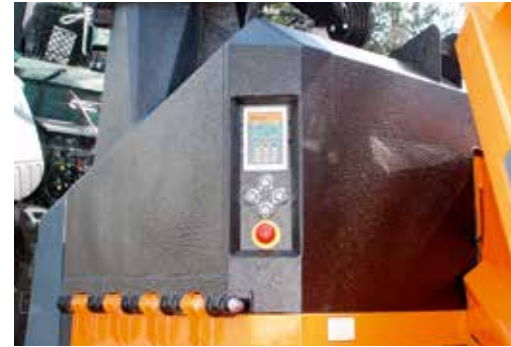
Standaard Antistress systeem "SPECIAL ADVANCED" met unieke elektronische functies en veiligheden.