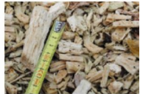
TV22-32 P; snippers geschikt voor verwarming of energiewinning (optie).