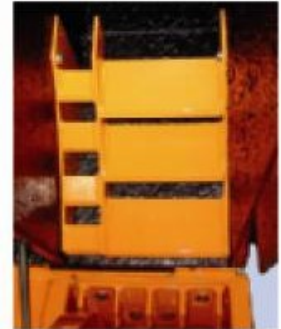
TV22-32 P; kalibratie systeem (optie).

B : 1960mm 1350kg H1: 3070mm H2: 1770mm L : 3620mm