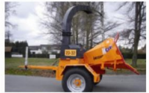
Onderstel voor traag vervoer 40 km/u

De meester van de wegberm. Robuuste werkkraft met onverzadigbare honger. Voor het versnipperen van twijgen, takken & stammen van eender welke houtsoort tot een diameter van 220mm. Verkrijgbaar in tractor aangedreven versie, al dan niet op getrokken onderstel.