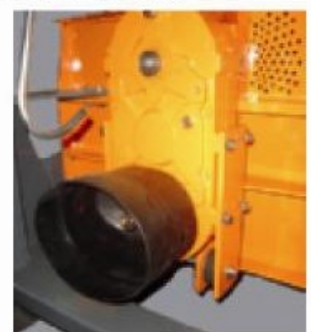
TV22-32 P; tandwielkast 540 toeren (optie)