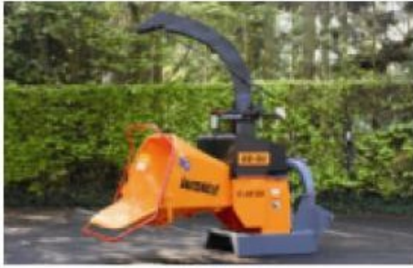
TV22-32 P; tractor aangedreven.