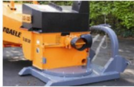
TV22-32 P; tractor aangedreven, 2x90° draaibaar (optie).