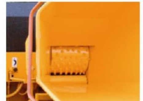
TV22-32 P; SUPER-GRIPP door invoerrol met noppen (standaard).